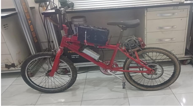
Gambar 2. Gambar sepeda listrik

Adapun model yang digunakan dalam sepeda listrik sebagai berikut: